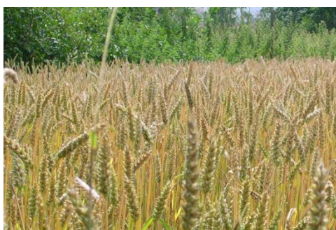
Abb. 1: Prozesse auf der Oberfläche von Saatgut sollen mit Plasmatechnik angeregt werden

Partner: Georg-August-Universität, Department für Nutzpflanzenwissenschaften TIGRES, Dr. Gerstenberg GmbH Ernst Benary Samenzucht GmbH van Waveren Saaten GmbH SUET Saat- und Erntetechnik GmbH N-Transfer