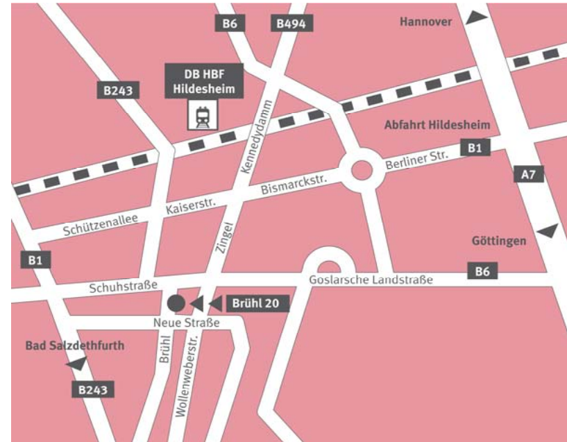
Abb. 1 und 2: Standorte der HAWK Hildesheim

Linie 2 (Ochtersum-Theodor-Stormstrasse) bis zur Haltestelle „Wollenweberstrasse“, dann 5 Minuten Fußweg.