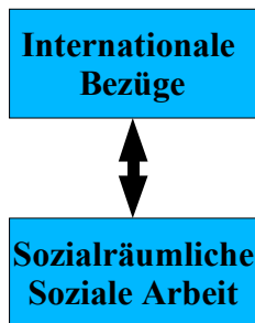
Abbildung 1: Soziale Arbeit im internationalen und sozialräumlichen Kontext

Soziale Arbeit ist durch schnelle Veränderungen der Gesellschaften und Lebenslagen auf allen Ebenen gekennzeichnet - von der internationalen über die europäische und nationale Ebene bis hin zur Region und dem Sozialraum eines Quartiers. Diese Ebenen stehen in einem zunehmendem Wechselverhältnis, wenn z.B. Wirtschaftsentscheidungen in internationalen Konzernzentralen die Lebensgrundlagen einer ganzen Stadt bestimmen, wenn Katastrophen, Armut und Kriege zu Migrationsströmen bis hin in die kleinen Städte führen oder, wenn sozialraumbezogene örtliche Initiativen Fördermittel der EU beantragen.